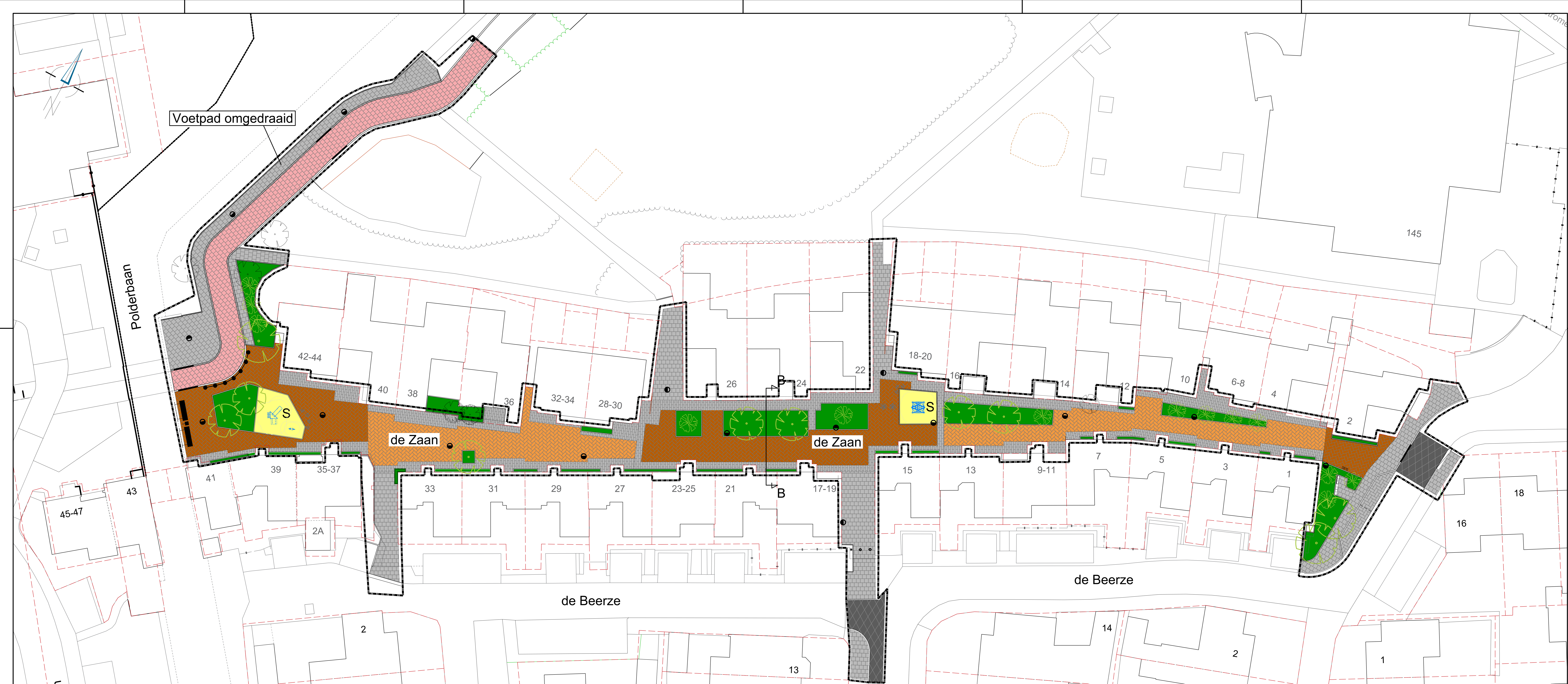
SITUATIE: DE ZAAN, OPTIE 1 SCHAAL 1:200